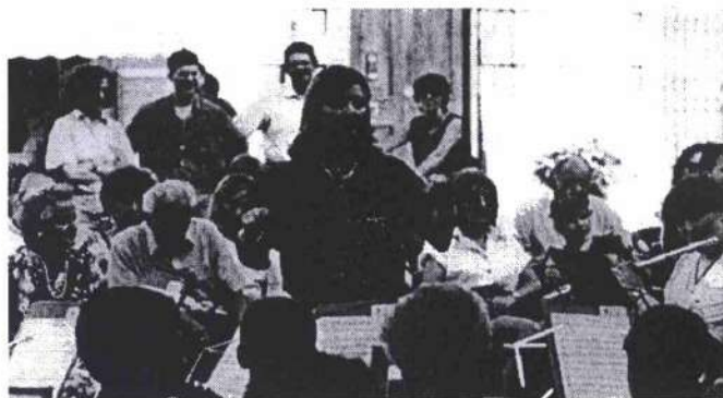
Una brano diretto da Marina a Montichiari