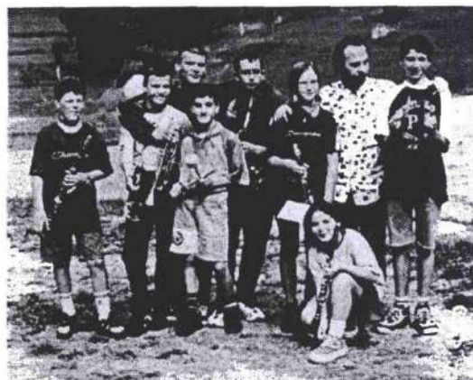
La squadra VIOLA