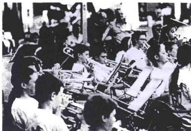
Trombe e tromboni durante il Concerto a Montichiari