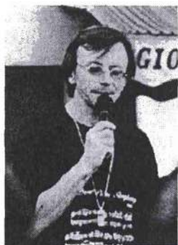
Gusperli dice che ...

dalla prima pagina • dalla prima pagina • dalla prima pagina • dalla prima pagina • dalla prima pagina • dalla prima pagina