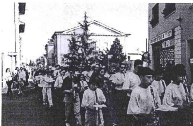
3. A Montichiari per l'ultima fatica. Sullo sfondo il vecchio ospedale

suonare; il repertorio non è variato molto rispetto allo scorso anno (Inno dei Marines e El Capitan), comunque sembra che pochi degli ascoltatori se ne siano accorti a giudicare dalla quantità di applausi che abbiamo ricevuto nelle sfilate che hanno preceduto i concerti.