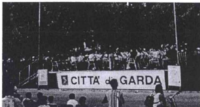
Tutti sul palco per il Concerto a Garda