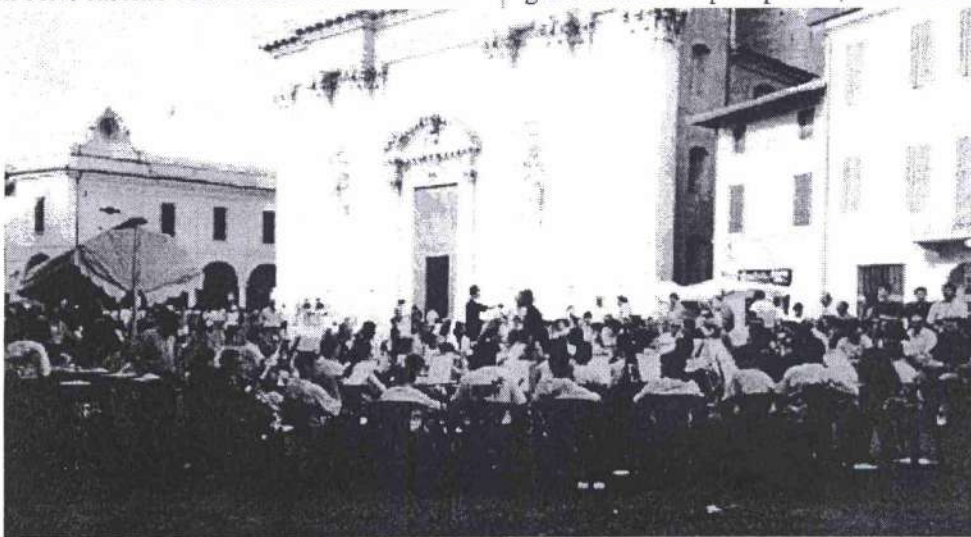
Preparativi per il Concerto in Piazza a Montichiari

Con due edizioni di campo alle spalle, tutti eravamo più preparati a ciò che ci aspettava. I cuochi avevano già la lista della spesa pronta, il medico l'armadietto dei medicinali pieno. I ragazzi più grandi si erano equipaggiati con lettore di Compact Disc e cibarie (... contravvenendo ad uno dei punti del regolamento); noi insegnanti abbiamo trovato anche il tempo di suonare in quintetto (flauto, oboe, clarinetto, corno e... sax baritono) musiche di Mozart e di Gordon Jacob.