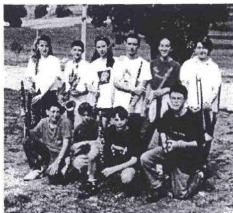
La squadra ARANCIONE