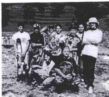
La squadra BLU