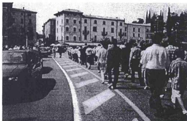
2. Sfilata a Peschiera con accompagnatori al seguito

Anche quest'anno ci siamo fatti le nostre belle scarpinate marciando tutti in fila come perfetti - o quasi - soldatini. Prima senza strumento, in fila indiana per controllare squadra per squadra che tutti partisero col sinistro e mantenessero giusto il passo; poi tentando di