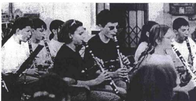
Un piccolo gruppo di clarinettisti durante il Concerto a Montichiari

Il secondo concerto è stato eseguito a Peschiera del Garda nella Piazzetta Arilicense, dove c'è la Torre dell'Orologio che, nel bel mezzo, ha incominciato a suonare accompagnando il nostro concerto con un sottofondo fuori programma.