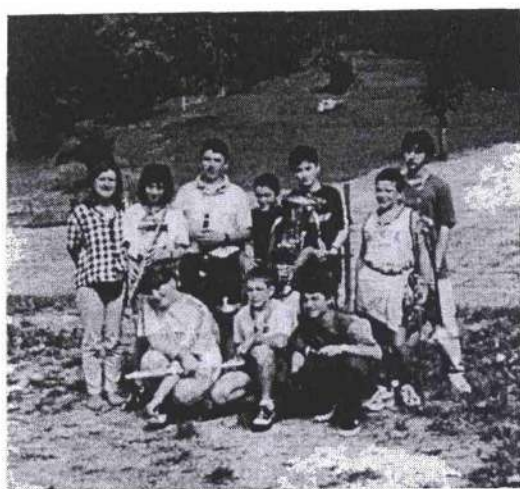
La squadra AZZURRA