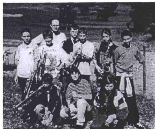
La squadra ROSSA