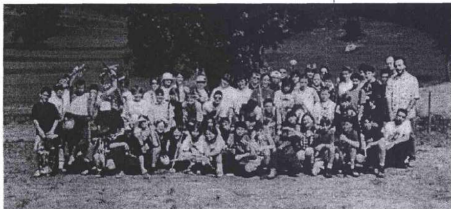
Tutti insieme appassionatamente nel giardino della casa di Lumini

P er il terzo anno consecutivo la ridente (o piangente, per via dei numerosi scrosci di pioggia!) località di Lumini ha accolto fra le sue verdi vallate l'orda dei cemmini. Chi l'avrebbe mai detto! Quando lanciavi l'idea, quasi quattro anni sono passati se si considera anche il tempo di gestazione e discussione dell'idea, molti visi si fecero seri, altri commentarono ironicamente, qualcuno però prese sul serio la proposta! Ed eccoci qua, a ricordare le disavventure della terza edizione.