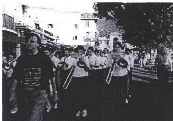
1. La sfilata nella bellissima ed accogliente Città di Garda